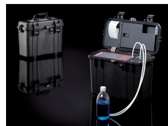
Robusta carcasa PAMAS GO

Todas las versiones son posibles, opcionalmente en la robusta carcasa PAMAS GO.